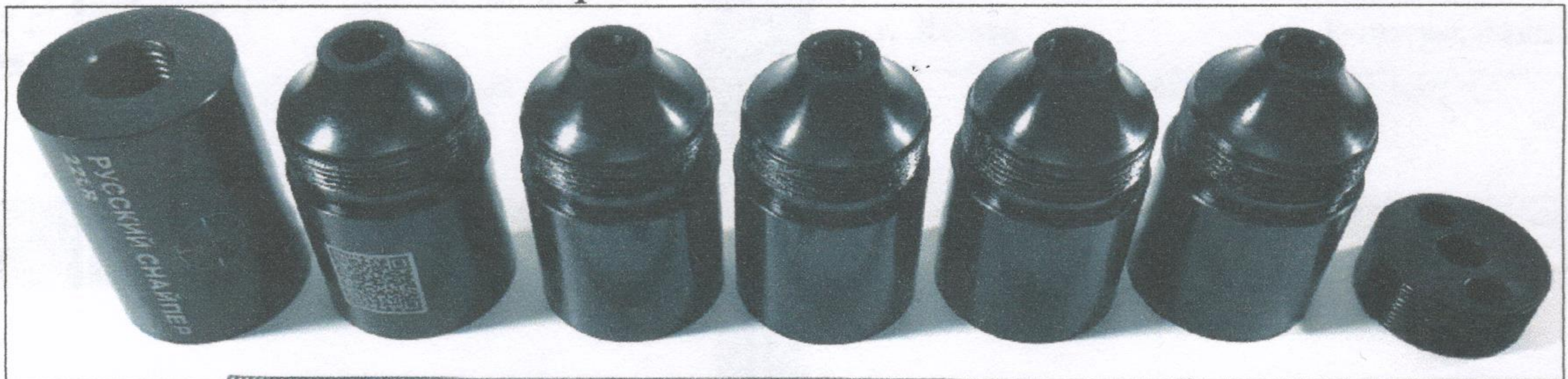
Исследование №2. Представленный объект в разобранном виде.