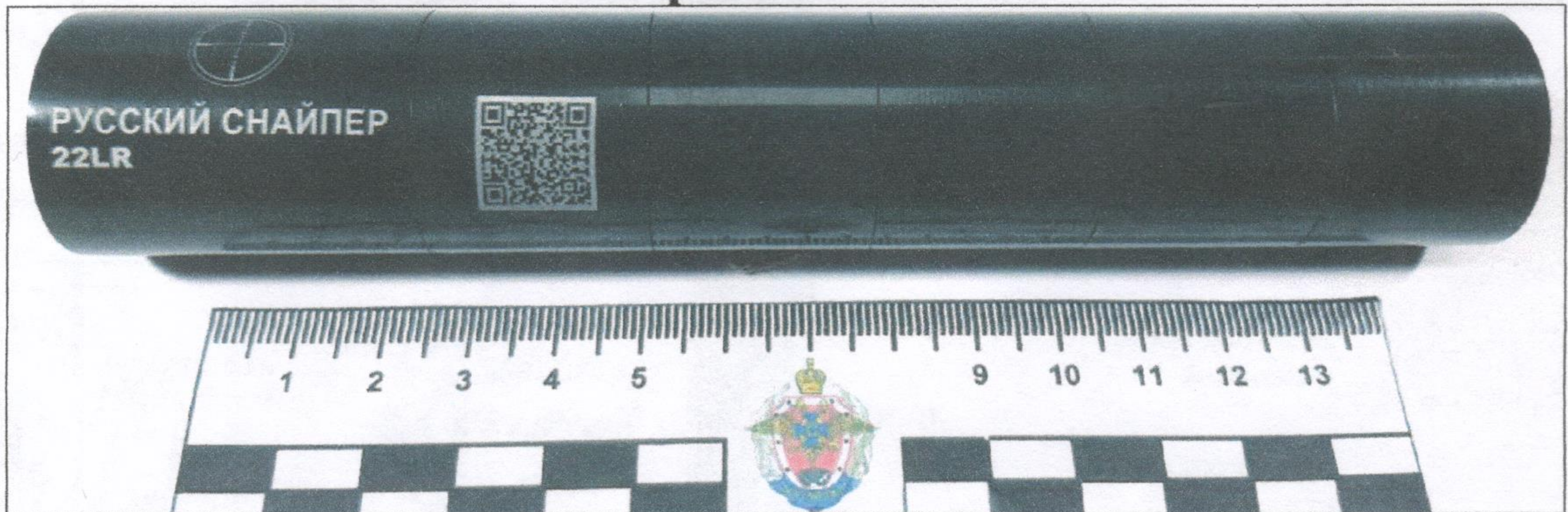
Исследование №1. Представленный на исследование объект.