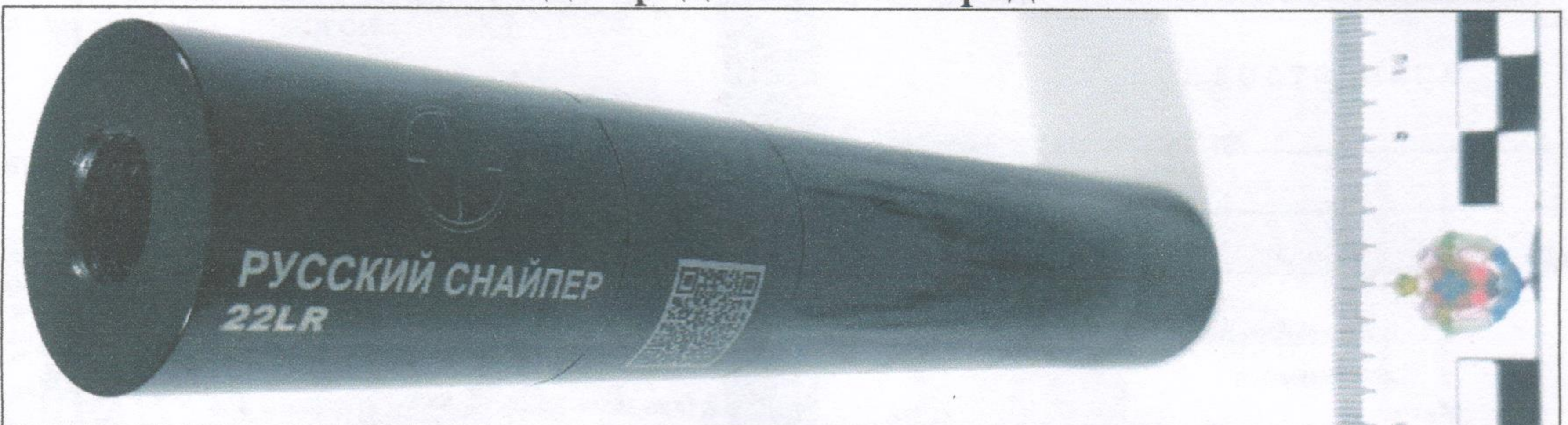
Исследование №4. Вид задней части представленного объекта.